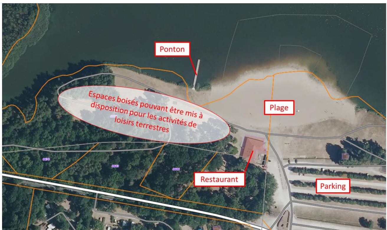
Plan des espaces de la base de loisirs

L'utilisation de l'étang pourra également être autorisée si nécessaire, tout comme le ponton d'embarquement (voir plan ci-dessous). Le règlement de la base de loisirs, listant et localisant notamment les activités autorisées sur l'étang, est annexé au cahier des charges. Il est à noter que les embarcations à moteur sont interdites.