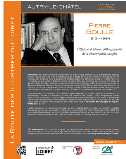
Exemples du panneau de Pierre Boule d'Autry-le-Château.