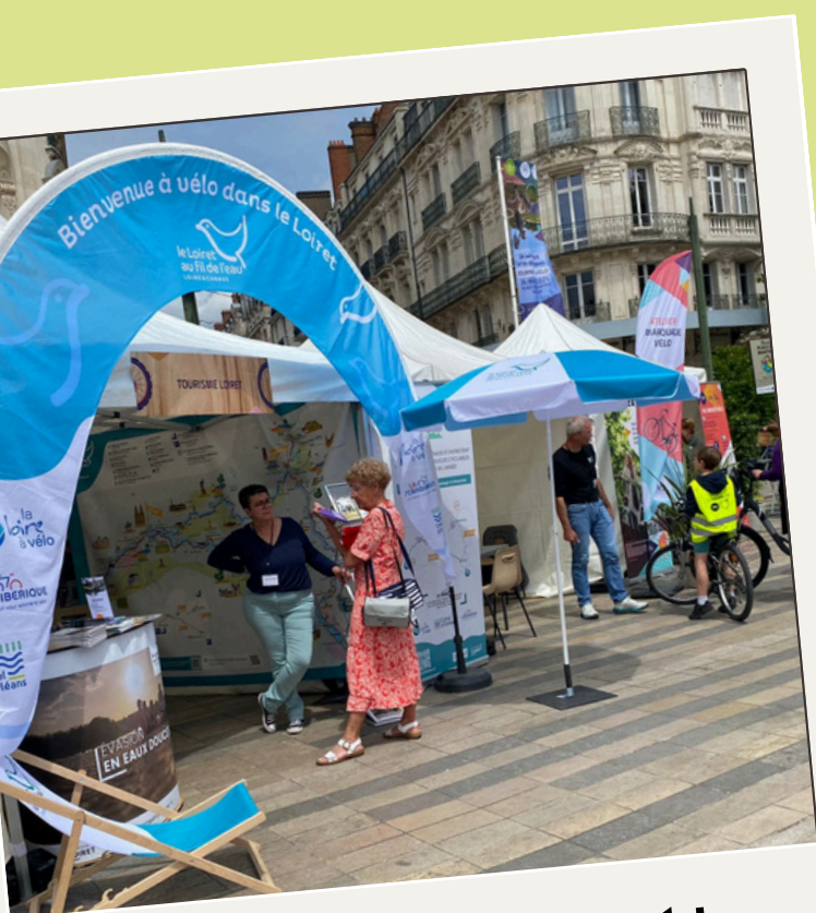
Journée du vélo