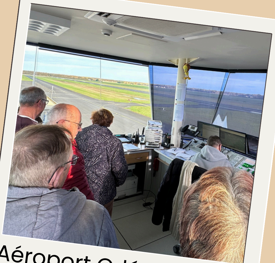
Aéroport Orléans Loire Vallée