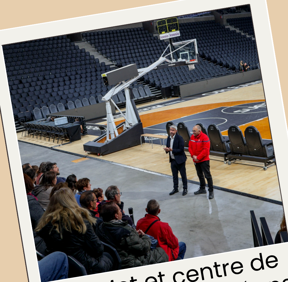
Co'Met et centre de conférence d'Orléans