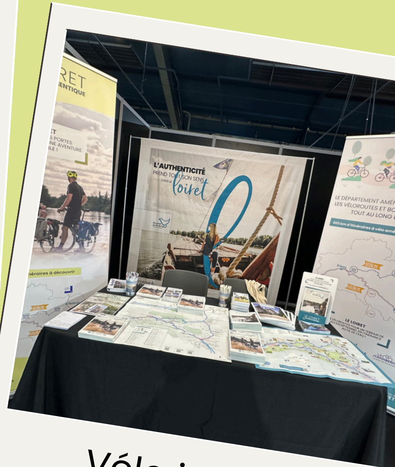
Vélo in Paris