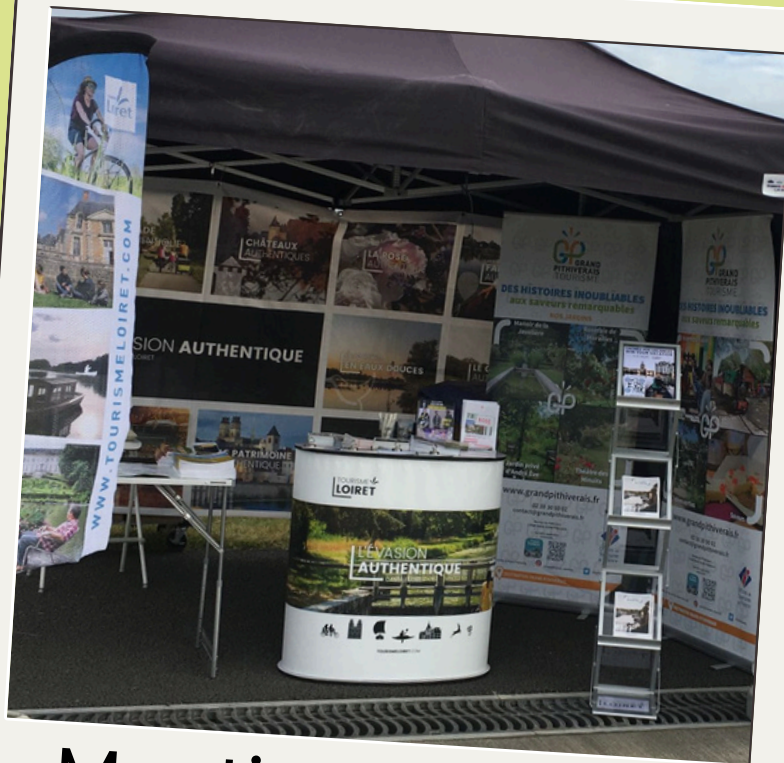
Meeting National Aérien